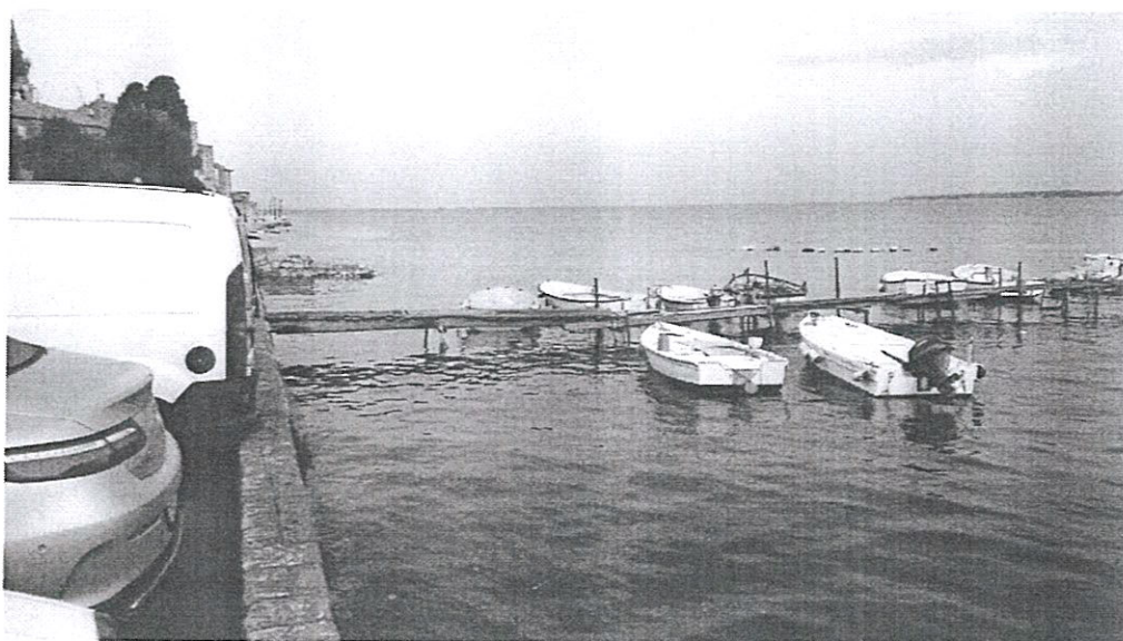
FOTO ZAPISNIK MOLA U UVALI PEŠKERA